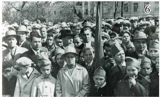
6. Воспитанники школы-интерната на митинге