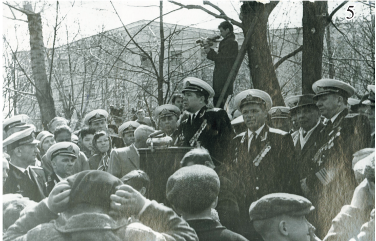
5. Митинг на открытии памятника 9 мая 1965 года

В фондах Музея истории Кронштадта хранится альбом с фотографиями 1965 года. Представляем вашему вниманию фотографии из этого альбома.