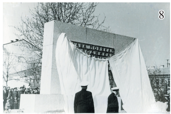
8. Открытие памятника