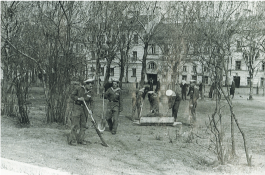
2. Военнослужащие на работах по благоустройству 3. Укладка асфальта вокруг сквера