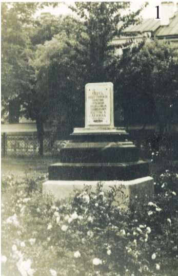
1. Временный памятник с указанием, что на этом месте будет сооружен памятник подводникам, защищавшим во время Великой Отечественной войны подступы к городу Ленина

Есть в Кронштадте место, которое знает каждый. Многие из нас, проходя по скверу подводников, даже не подозревают, что ещё