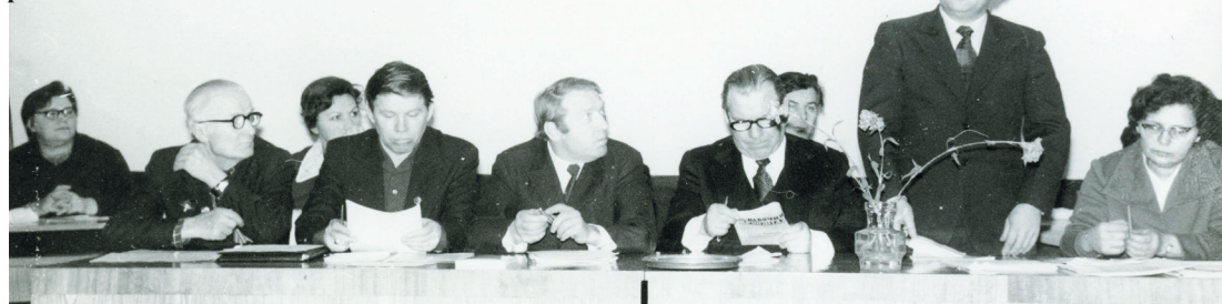
Отчетно-выборочная конференция Кронштадтского отделения Всероссийского общества охраны памятников истории и культуры 20.01.1977 г.

18 апреля – Международный день памятников и исторических мест (День всемирного наследия). Накануне этого дня хочется вспомнить о деятельности Кронштадтского районного отделения Всероссийского общества охраны памятников истории и культуры.