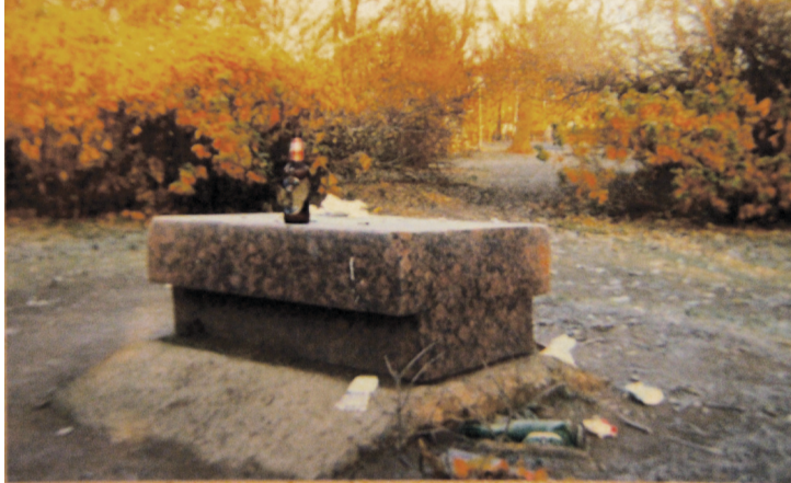
Так выглядел закладной камень перед началом реставрации Якорной площади.

В северном Соборном сквере установлен закладной камень в знак того, что здесь в свое время откроется памятник, посвященный героям знаменитого кронштадтского мятежа. Открывается ли?