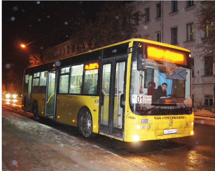
Автобус маршрута № 101 больше не подает под посадку за 2 минуты до отправления.

Отсутствие в Кронштадте диспетчерского пункта – главное препятствие, мешающее нормально организовать транспортное сообщение внутри района и с Большой землей.